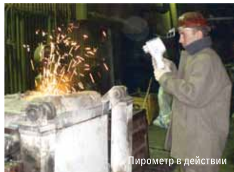
Пирометр в действии

В сентябре приступили к модернизации оборудования, предназначенного для литья под низким давлением. На нем изготавливаются отливки на