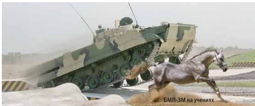
БМП-3М на учениях

Всем известно, что в Арабских Эмиратах ценят роскошь, красивых женщин и знают толк в лошадях. Однако времена меняются, меняются и вкусы шейхов. На сегодняшний день большое количество боевых машин пехоты (БМП) закупается именно Арабскими Эмиратами.