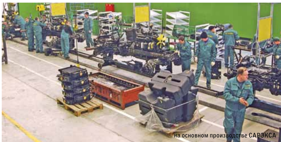
на основном производстве САРЭКСа

Проблемы были решены за счет внедрения топ-менеджментом новых отношений с партнерами по машиностроительному комплексу и потребителями