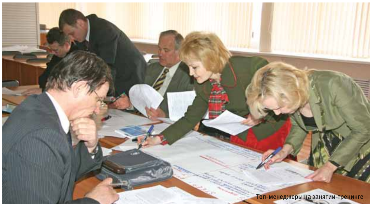
Топ-менеджеры на занятии-тренинге

Данный комплекс программ позволил сформировать командный стиль работы. Всех их объединила культура коллегиального принятия решений и общий управленческий язык. Так единый центр обучения Промтрактора положил начало изучению конкретных управленческих ситуаций, проведению мониторинга перспективных идей из современной мировой практики.