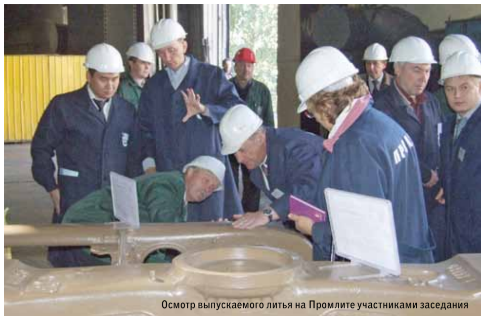
Осмотр выпускаемого литья на Промлите участниками заседания

Сегодня партнерами машиностроительно-индустриальной группы в сфере образования являются Московский автомеханический институт МГТУ, Московский государственный агроинженерный университет им. В.П. Горячкина, Казанский государственный технический университет им. А.Н. Туполева, Чувашский государственный университет им. И.Н. Ульянова, Южно-Уральский государственный университет, Костромской профессиональный лицей № 23, Чебоксарский электромеханический