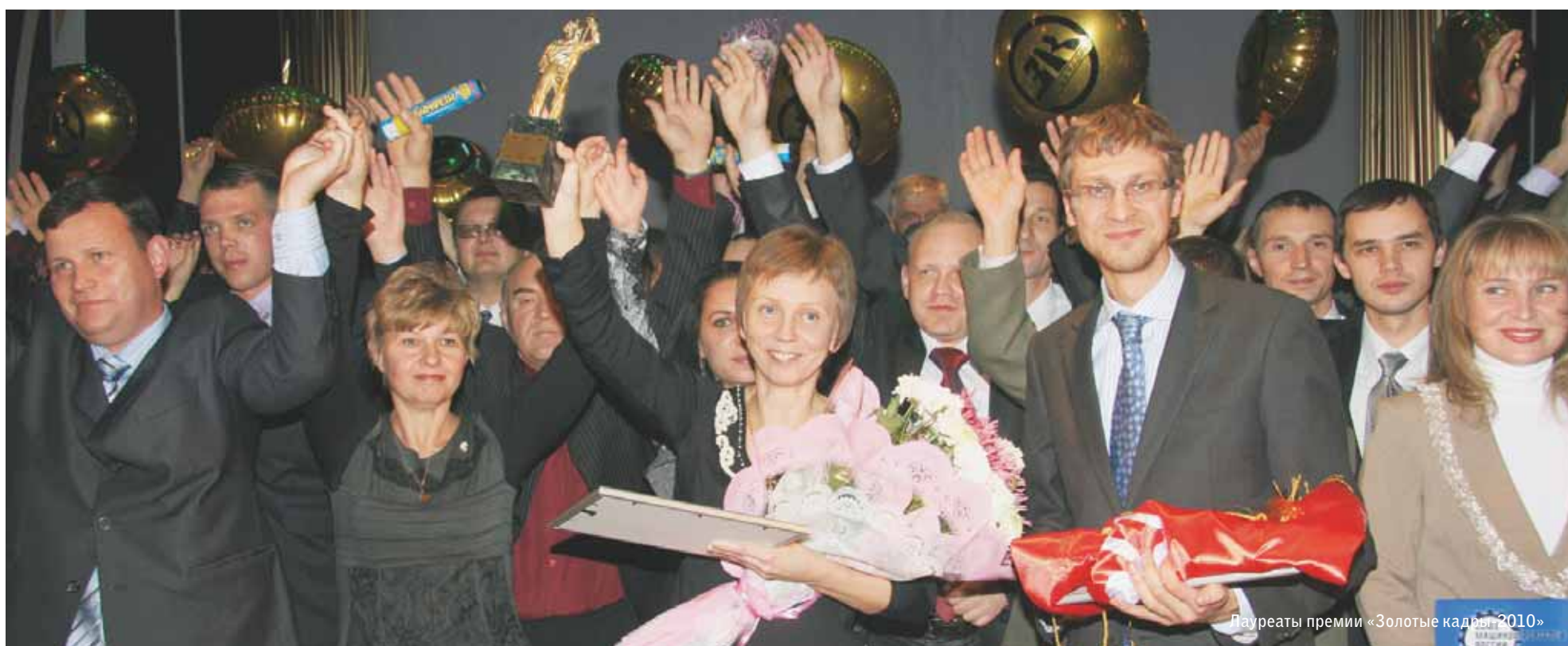
Лауреаты премии «Золотые кадры» 2010»