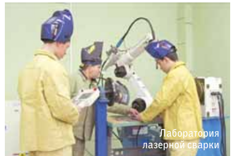
Лаборатория лазерной сварки

В таких условиях Концерн вправе делать заказ на подготовку именно тех специалистов, в которых нуждается. И даже активно участвовать в образовательном процессе и становлении учебно-производственного центра нового типа. Представители Концерна входят в состав Государственной экзаменационной комиссии ЧЭМК, участвуют в аттестации его сотрудников. На экспертизу специалистам колледж отдает все интегрированные учебные планы и программы. Представители предприятий холдинга курируют курсовые и дипломные проек-