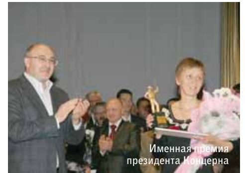
Именная премия президента Концерна