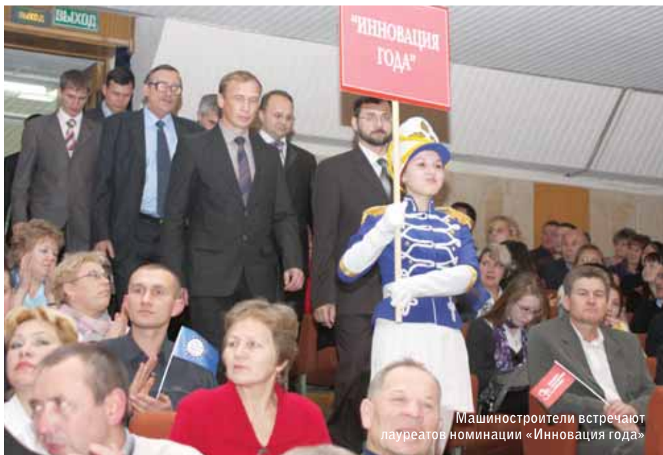
Машиностроители встречают лауреатов номинации «Иновация года»

Именно исходя из этого тезиса на государственном уровне было принято решение спроектировать и выпустить современные лесозаготовительные машины в нашей стране.