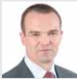
Михаил ИГНАТЬЕВ, Президент Чувашской Республики