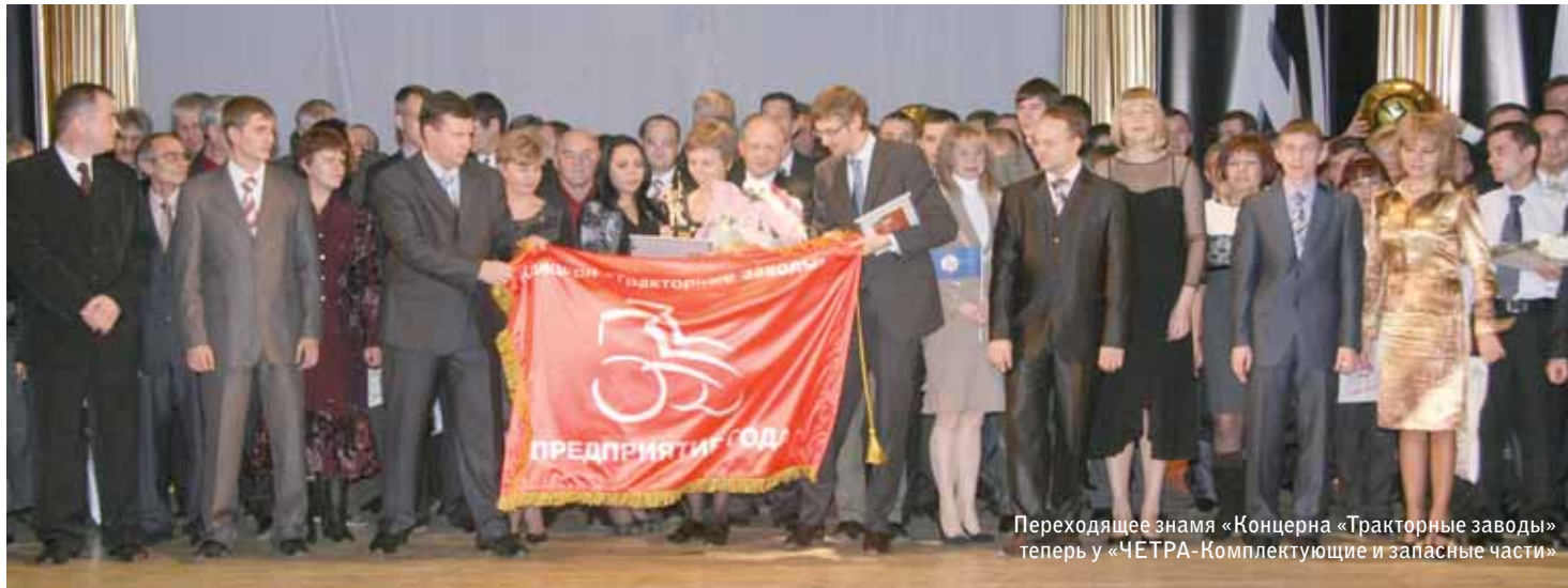
Переходящее знамя «Концерн «Тракторные заводы» теперь у «ЧЕТРА-Комплектующие и запасные части»

29 октября под патронажем Союза машиностроителей России состоялось одно из важнейших событий уходящего года – церемония награждения лауреатов престижной ежегодной профессиональной премии машиностроительного комплекса России – «Золотые кадры «Концерн «Тракторные заводы»-2010». Имена 138 лучших работников, специалистов и руководителей из 27 компаний 10 субъектов РФ вошли в летопись возрождения и становления отечественной промышленности.