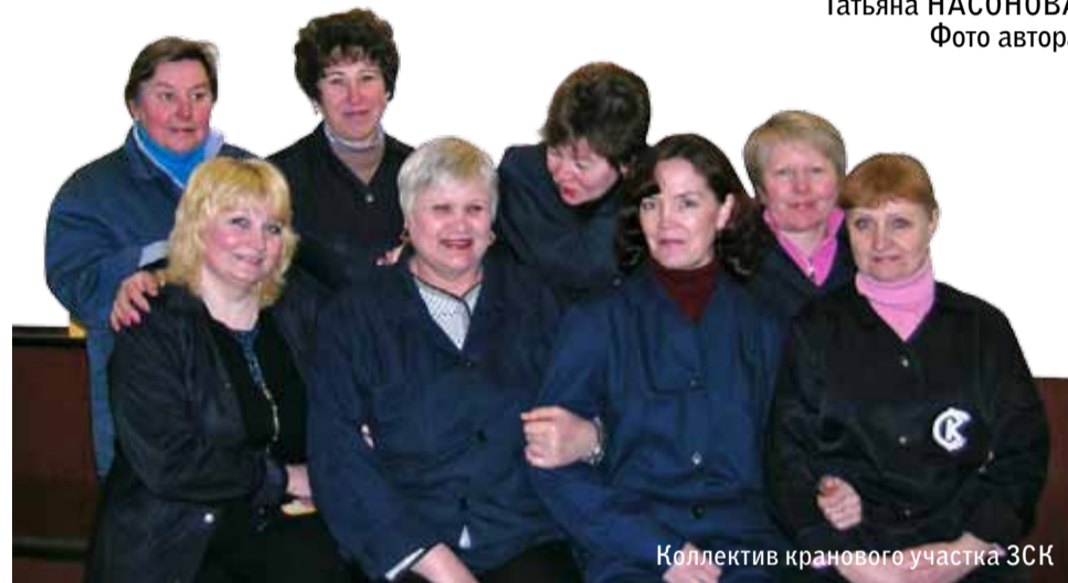
Коллектив кранового участка ЗСК