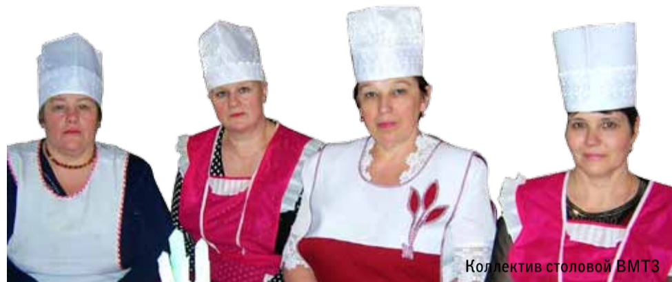
Коллектив столовой ВМТЗ

В меню заведения уже немало фирменных блюд, созданных на основе домашних рецептов: рулетки, булочки в