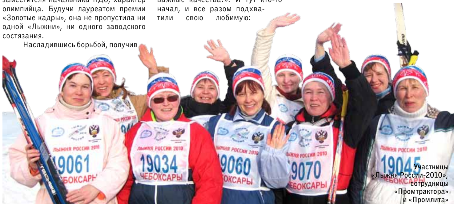
Участницы «Лыжня России-2010», сотрудницы «Промтрактора» и «Промлита»