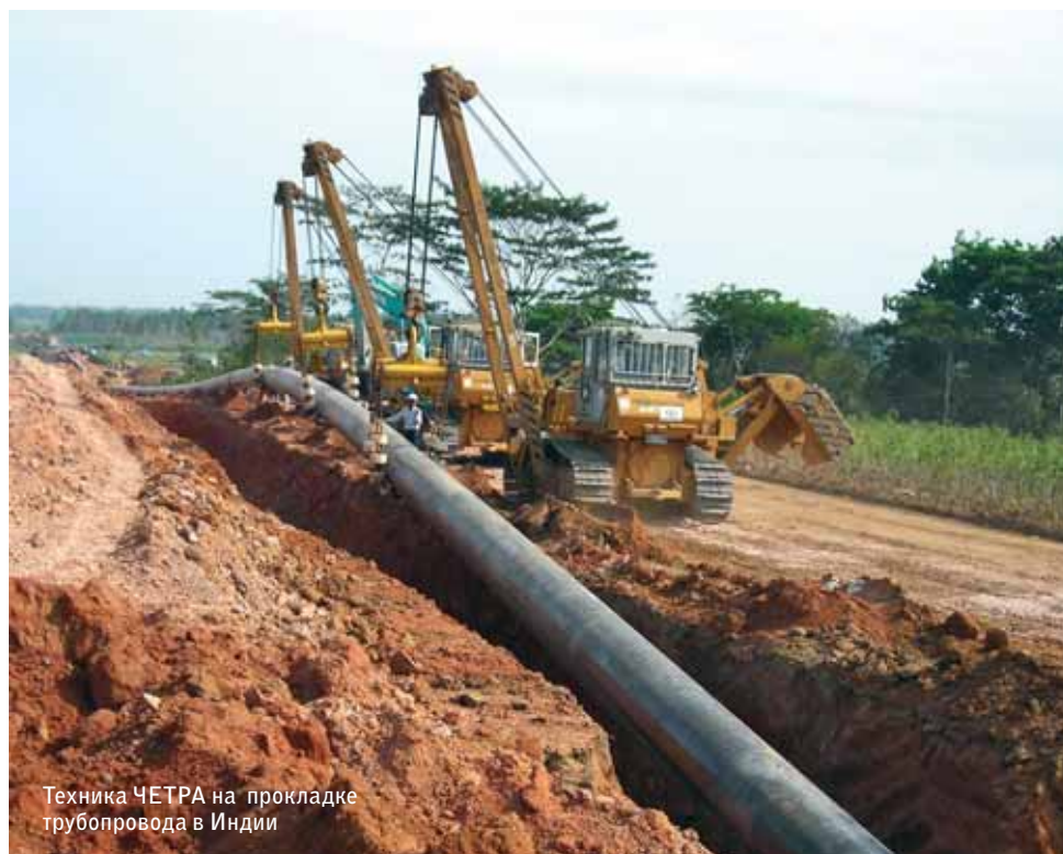
Техника ЧЕТРА на прокладке трубопровода в Индии

Беседовали Гелла НАМИНОВА и Татьяна БАБИНА