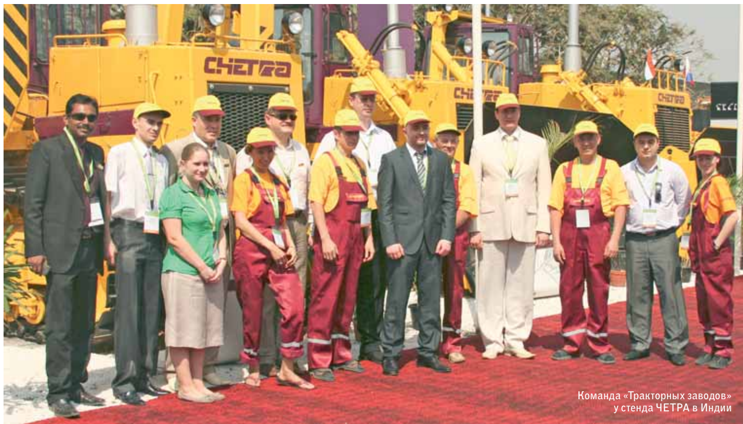
Команда «Тракторных заводов» у стенда ЧЕТРА в Индии