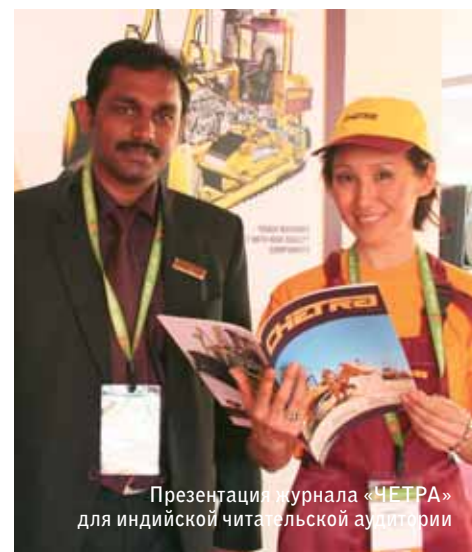
Презентация журнала «ЧЕТРА» для индийской читательской аудитории

сти к постоянно изменяющимся требованиям рынка.