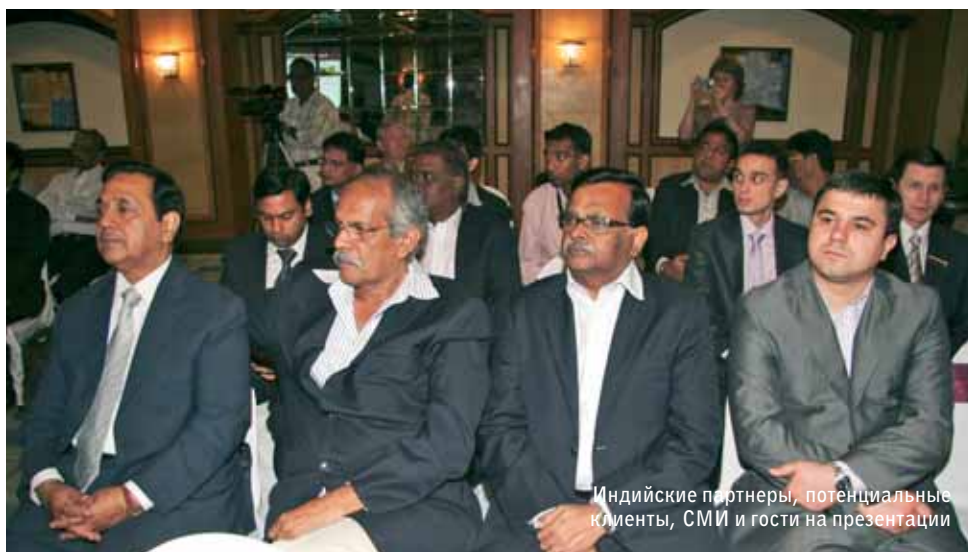
Индийские партнеры, потенциальные клиенты, СМИ и гости на презентации