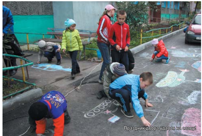
Праздник двора удался на славу!

Машиностроители занимаются не болтовней, а делом. Ни для кого не секрет, что каждый четвертый рубль в бюджете Чувашии — заслуга машиностроителей. Это деньги на обустройство дворов,