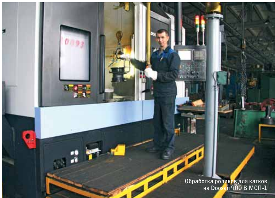
Обработка роликов для катков на Doosan 900 B МСП-1

На Чебоксарском агрегатном заводе идет реализация меморандума, в рамках которого до 2017 года будет проводиться масштабное техпереворужение предприятия.