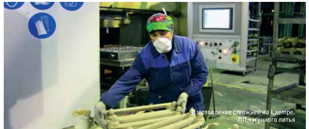
Изготовление стержней на Laempfe. ЛП чугунного литья

Я на собственном опыте убедился в неразрывной связи технического прогресса и личных устремлений рабочего, инженера стать классным специалистом. Новая техника дала мне «второе дыхание» и позволила за 11 лет работы на ЧАЗ пройти служебную лестницу от рабочего до начальника стержнеземлеприготовительного участка стального литья литейного производства. Техническое перевооружение агрегатного завода интересно рабочим и инженерам, дает молодым специалистам моральное удовлетворение от приобщения к литейным технологиям XXI века. В 2012 году на нашем участке установят еще два стержневых автомата фирмы Laempfe. От технического новшества выиграют все: молодежи интересно работать на современном оборудовании и отпадет искушение погнаться за «длинным рублем», производственники выполнят обширные заказы ОАО «РЖД» и предприятий «Концерна «Тракторные заводы» в рамках внутренней кооперации.