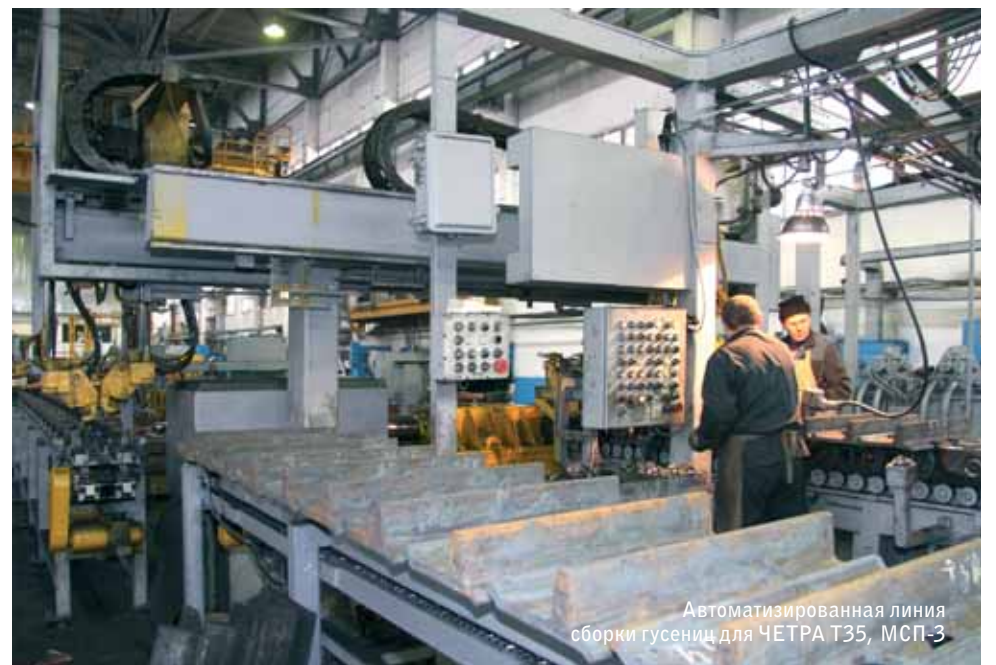
Автоматизированная линия сборки гусениц для ЧЕТРА Т35, МСП-3

Агрегатному заводу поручили серьезные заказы РЖД для серийного выпуска вагонов повышенной грузо-