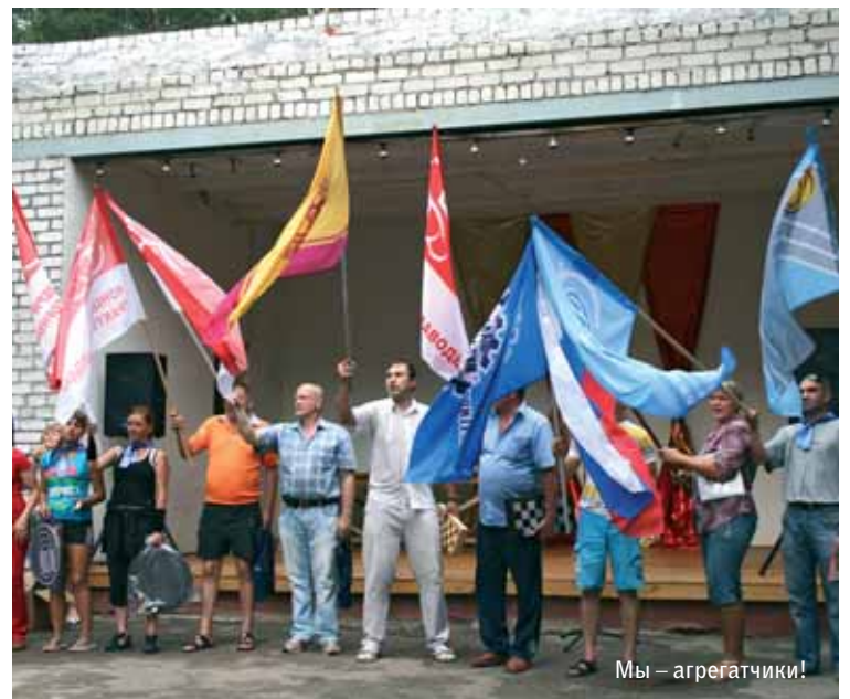
Мы – агрегатчики!

Учредитель: ООО «НКУ «Концерн «Тракторные заводы», 428000, г. Чебоксары, пр. Мира, 1. Зарегистрирована в Управлении по Чувашской Республике Россвязьсохранкультуры. Свидетельство о регистрации ПИ №ТУ 21-00052