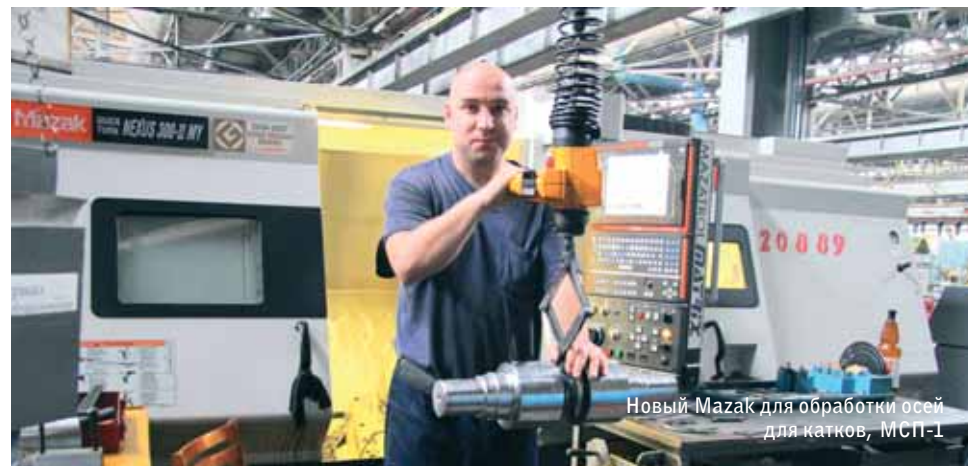
Новый MazaK для обработки осей для катков, МСП-1

Дорогу осият идущие, – считают на ЧАЗ. В ближайшие годы здесь значительно увеличатся объемы производства, и на то имеются предпосылки: сотни миллионов рублей вложены в техническое перевооружение, проводится грамотная политика освоения новой продукции.