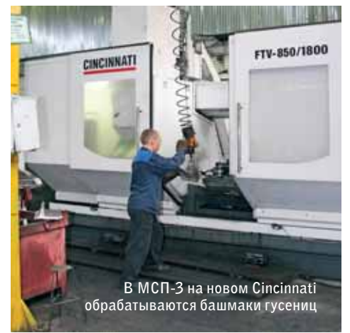
В МСП-3 на новом Cincinnati обрабатываются башмаки гусениц

По товарам народного потребления реализуется долгосрочная программа «100 замков». В соответствии с ней планируется довести номенклатуру данного вида продукции до ста наименований. Основная тематика – навесные замки. Это рынок, на котором ЧАЗ бесспорно занимает лидирующую позицию. В ассортименте появляются и изделия с кодовым механизмом секретаря, и механизмы с латунными корпусами, новые замки специализированного назначения для мото- и автотехники. Существенная экономическая отдача ожидается от внедрения нового упаковочного оборудования для изготовления блистеров на замочное производство. Ранее же заводу приходилось заказывать их у сторонних производителей.