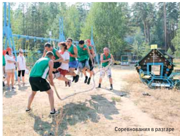
Соревнования в разгаре

На творческом вечере «Мы – агрегатчики!» команды представили эстрадные миниатюры и хореографические но-